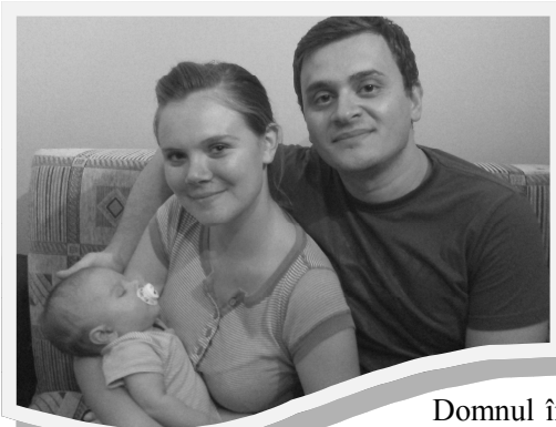
Domnul îi va asculta și le va arăta îndurare.