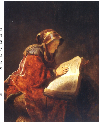
▼ Proorocița Ana, de Rembrandt